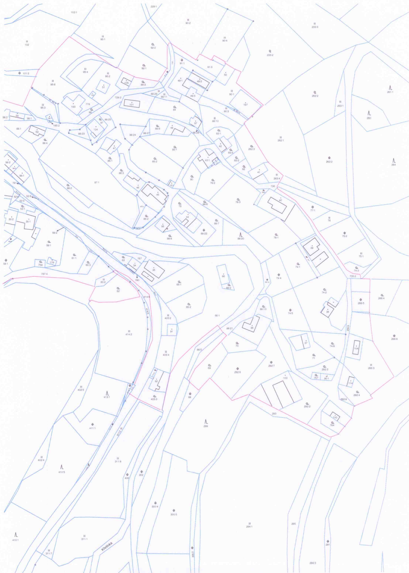
ZASTAVĚNÉ ÚZEMÍ OBCE HORNÍ POŘÍČÍ 2020 - LIST "D"