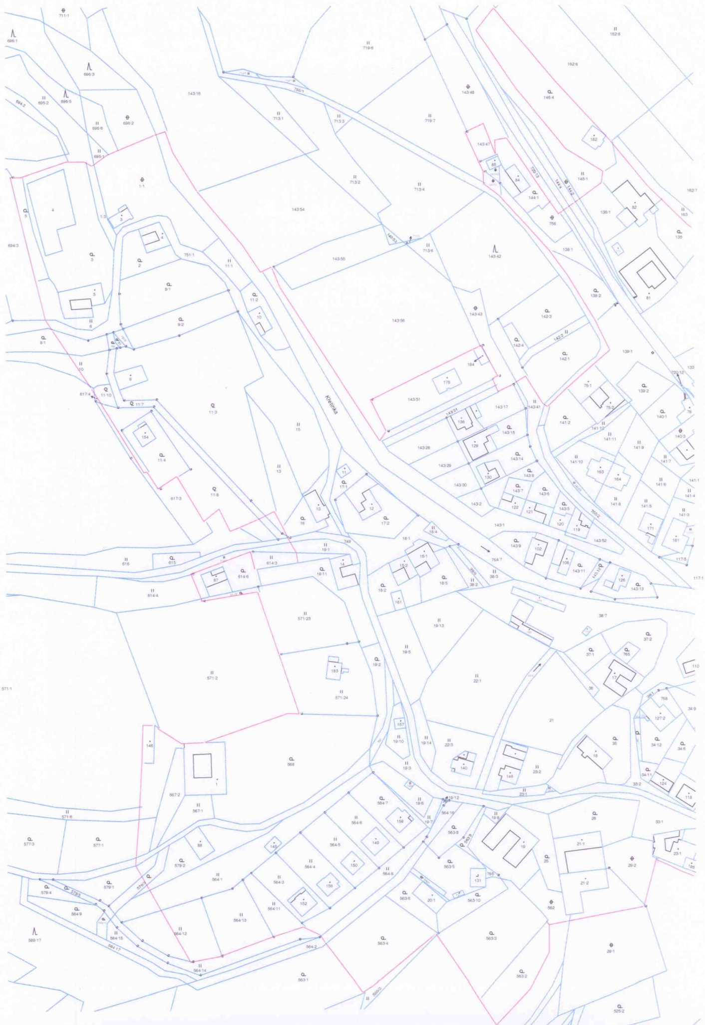
ZASTAVĚNÉ ÚZEMÍ OBCE HORNÍ POŘÍČÍ 2020 - LIST "A"